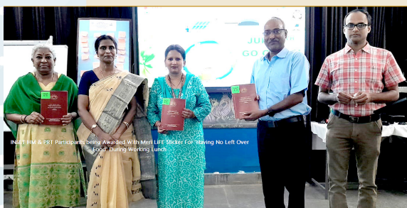
INSETI HM & CRT Participants Being Awarded With Merit LiFE Sticker For Having No Left Over Food During Workshop Lunch

Throughout the KVs, LiFE-related curriculums became a regular feature, focusing on videos, seminars, and guest lectures about environmental best practices. Green boxes provided a platform for innovative ideas, while leaflets shared valuable insights on conservation.