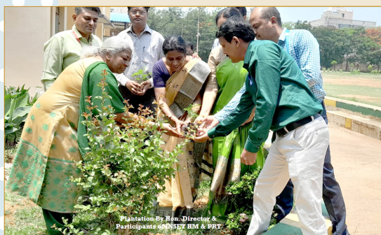
Plantation By Hon. Director & Participants of INSETI HM & CRT